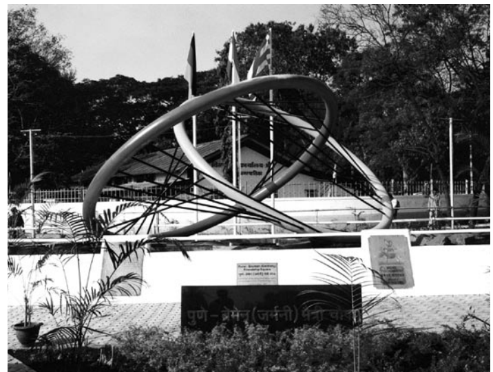
Pune-Bremen Maitry Chowk